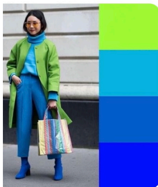
Combinación: Ideas para inar colores de tu outfit ...