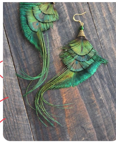
... Peacock earrings ...